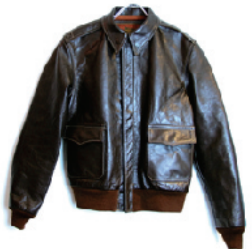
TSL A-2 Flight Jacket

厳選した一級の素材と伝統の技術を駆使して究極のA-2フライトジャケットが出来上がりました。